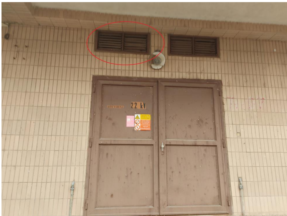
Obr. 3: Ukážka potenciálnych sezónnych úkrytov netopierov/hniezdísk vtákov v podobe poškodených vetracích otvorov a mreží