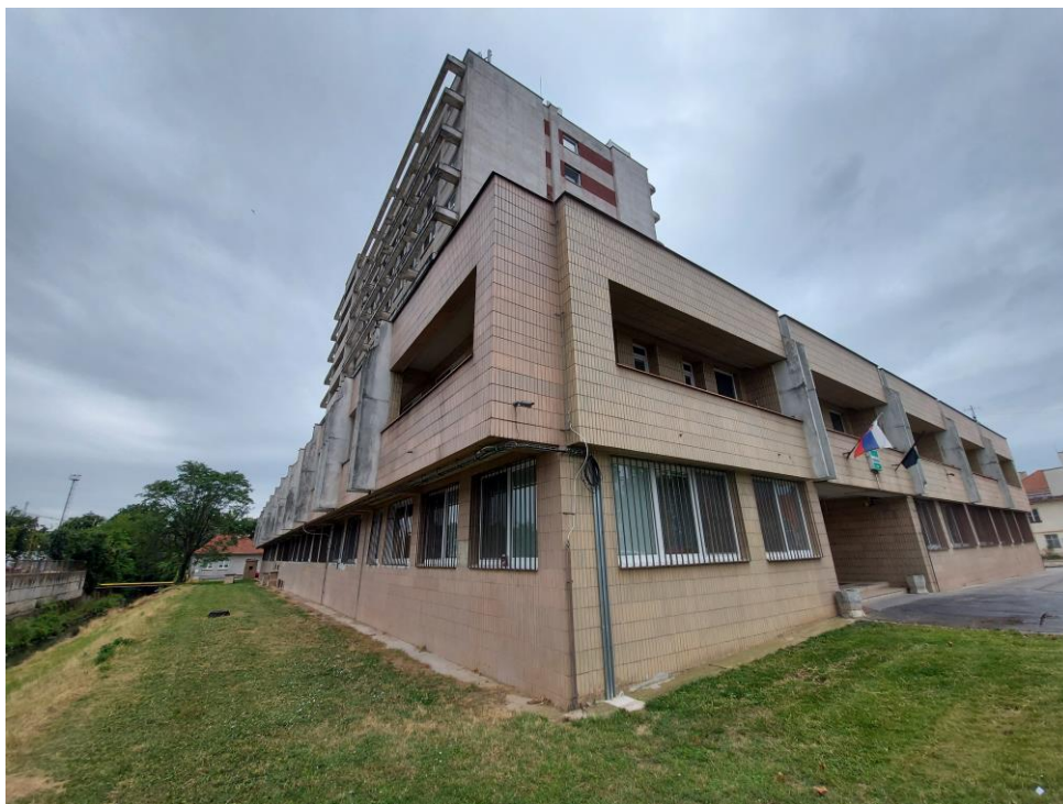
Obr. 1: Obhliadnutý objekt KR PZ v Trnave

Poverenie č. ŠOP SR/243-001/2023 platné do 31.12.2027