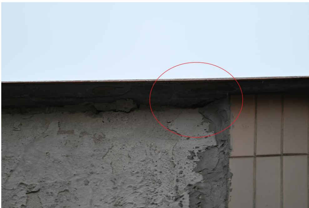
Obr. 6: Ukážka potenciálnych sezónnych úkrytov netopierov/hniezdísk vtákov v podobe klampiarenských krycích materiálov