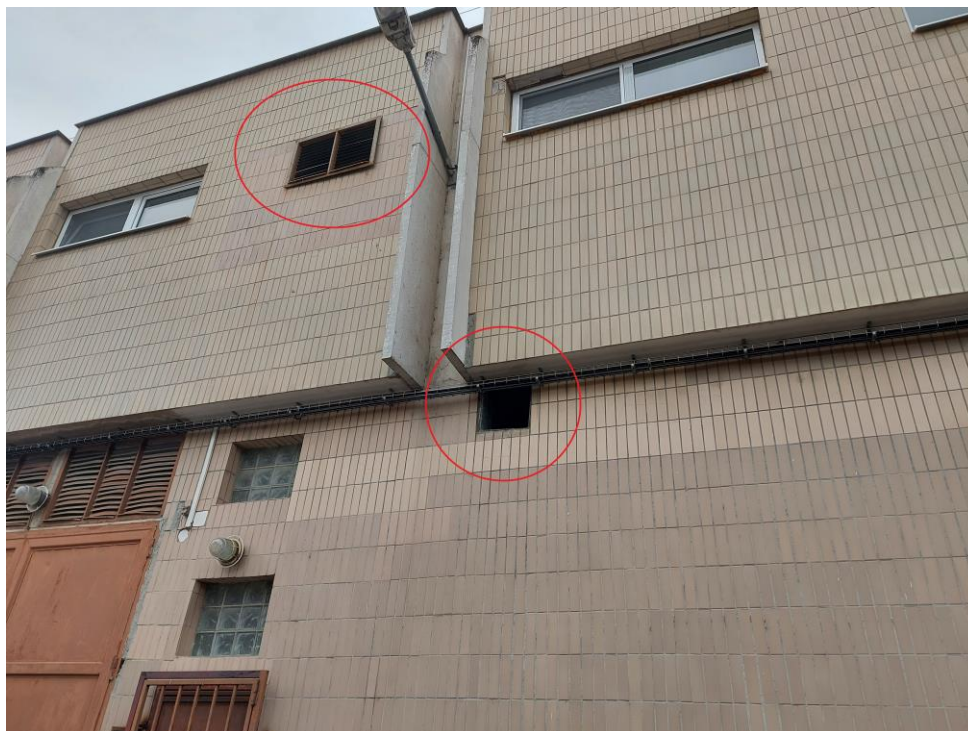
Obr. 2: Ukážka potenciálnych sezónnych úkrytov netopierov/hniezdísk vtákov v podobe poškodených vetracích otvorov a mreží