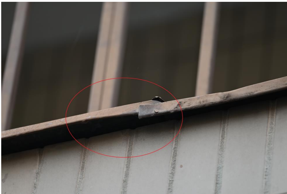
Obr. 4: Ukážka potenciálnych sezónnych úkrytov netopierov/hniezdísk vtákov v podobe klampiarskych krycích materiálov