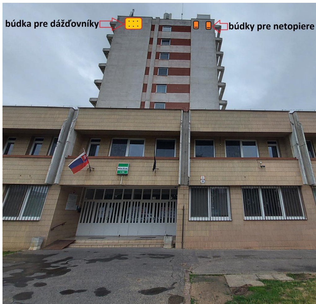
Obr. 8: Návrh umiestnenia 1 „6-komorovej“ búdky pre dážďovníky tmavé (napr. typ BAT-MAN APUS6) a 2 ks búdok pre netopiere (napr. Strobel 123) na severnej stene (južná sa neodporúča kvôli prehrievaniu)

Poverenie č. ŠOP SR/243-001/2023 platné do 31.12.2027